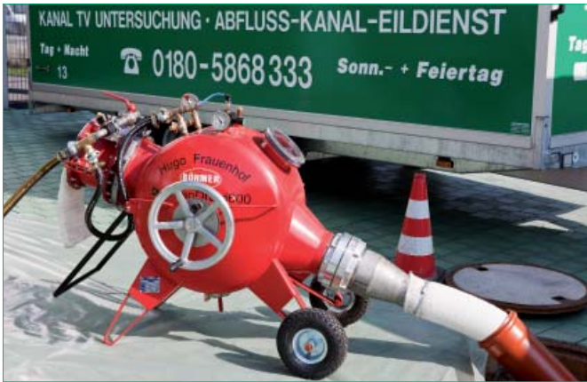
LinerGun-Trommel im Einsatz

Kanalreparaturen stellen sowohl ökonomisch als auch ökologisch hohe Ansprüche an die ausführende Firma. Nicht nur geschultes Wissen und Erfahrung, sondern auch innovative Technologien und zugelassene Materialien sind notwendig, um eine qualitativ hochwertige, langanhaltende Kanalreparatur effizient auszuführen.