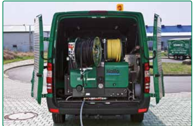
Heckansicht Servicewagen Rohr- und Kanalreinigung

Wir garantieren Ihnen, dass unsere Maßnahmen aufeinander abgestimmt sind und garantieren ein qualitativ hochwertiges Ergebnis unserer Arbeiten.