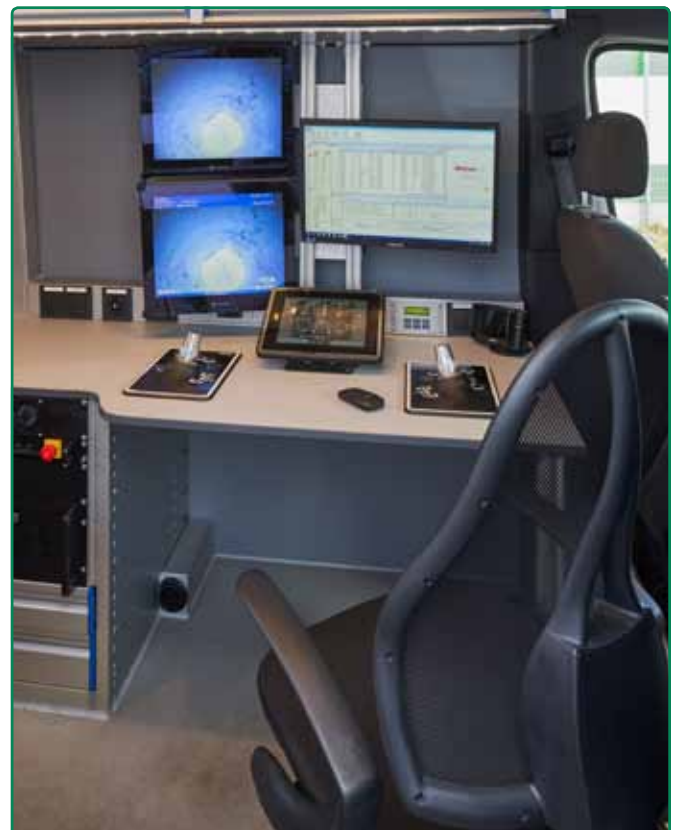
Komplett ausgestattete Service-Fahrzeuge