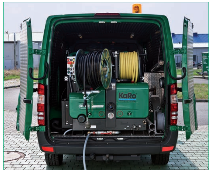
Heckansicht Servicewagen Rohr- und Kanalreinigung

Das Fahrzeug (26 t) kann Saugarbeiten bis zu einer Kanaltiefe von 10 m durchführen und bspw. mehrere Halterungen am Stück spülen. Eingesetzt wird es u. a. in der Städte- und Industriereinigung.