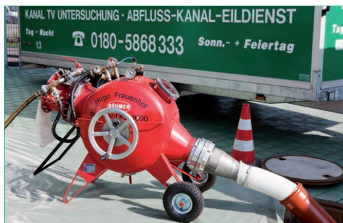
LinerGun-Trommel im Einsatz

Kanalreparaturen stellen sowohl ökonomisch als auch ökologisch hohe Ansprüche an die ausführende Firma. Nicht nur geschultes Wissen und Erfahrung, sondern auch innovative Technologien und zugelassene Materialien sind notwendig, um eine qualitativ hochwertige, langanhaltende Kanalreparatur effizient auszuführen.